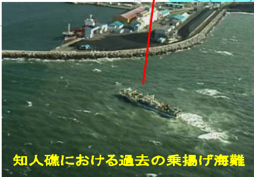
知人礁における過去の乗揚げ海難