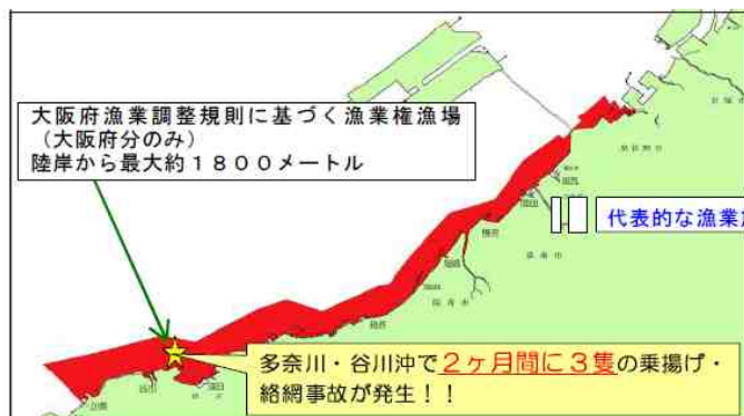
沿岸海域（赤色）内に設置されている漁業施設

大阪湾南部沿岸の海域には、漁礁・定置網・いけす等 多くの漁業施設が海上に設置 されています。 冬場には「のり網」も多数設置 され、発見が遅れたりすると、乗揚げたり網に絡んだりし、航行ができなくなることもあります。これらの施設は種類や漁期により設置位置が変わる場合もあり、喫水が深い船舶がこの海域を航行する場合は、 十分な注意が必要です 。