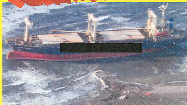
<走錨し、座礁した船舶です。>