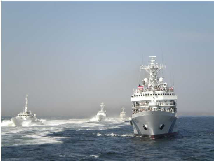
海上保安庁 第三管区 巡視船艇・航空機展示総合訓練