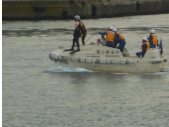
「救助に向かう海上保安官」 著者撮影：海上保安庁 第一管区海上保安本部 訓練