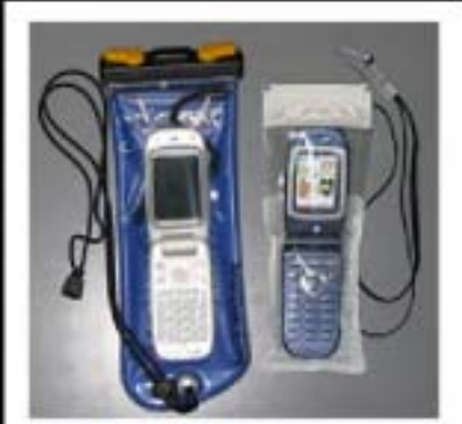
携帯電話用防水パック