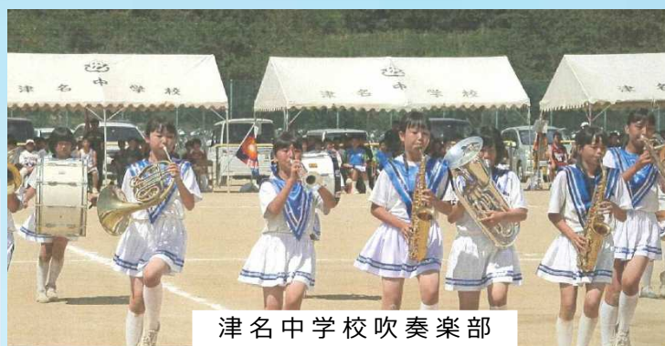
津名中学校吹奏楽部

大阪湾海上交通センター駐車場は台数に限りがありますので無料バスを運行しております。