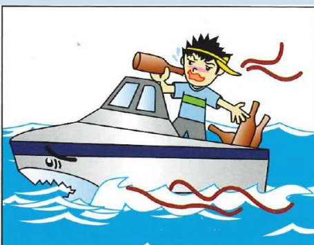
酒酔い操縦等の禁止