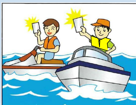
免許者の自己操縦