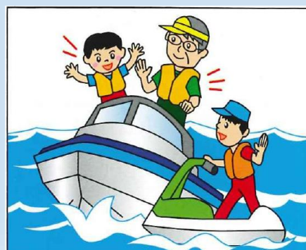
救命胴衣の常時着用