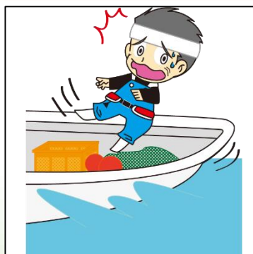
図) 操業中の漁船各種事故 (病気を除く)