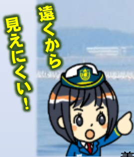
養殖海苔網施設写真

沿岸部に海苔網が設置されており、暗くなるほど視認が困難です！ 以前航行できた海域でも海苔網が設置され、乗揚げの危険があります！