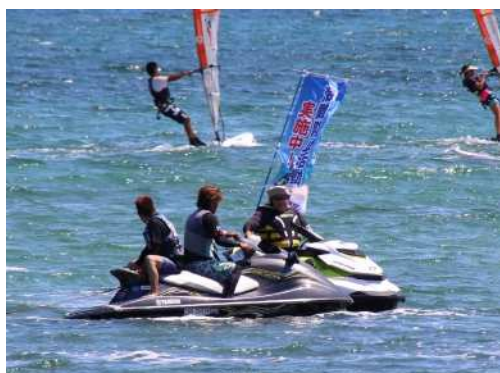
合同パトロール（海上安全指導員）による安全啓発活動