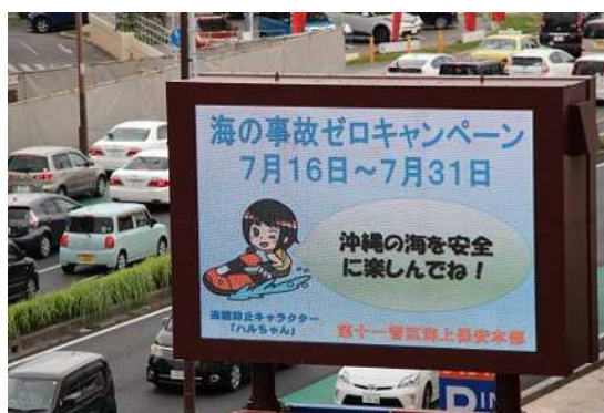
電光掲示版による周知