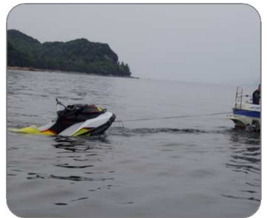
＜参考＞事故を起し航行不能となり、曳航救助される水上オートバイ