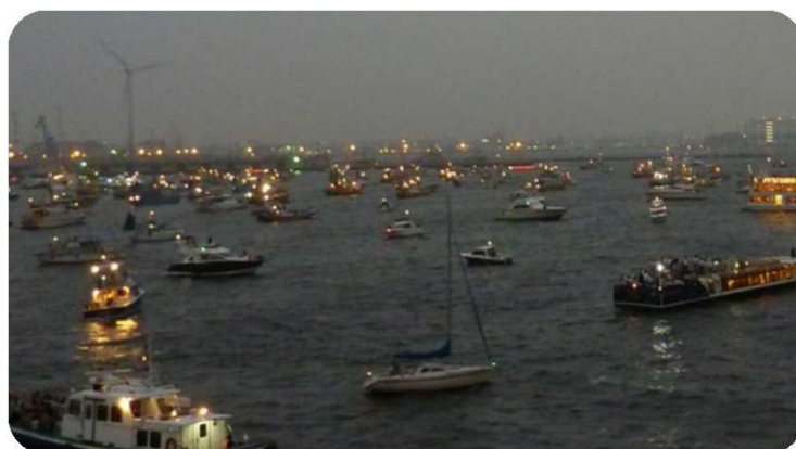
<参考>花火大会を観覧する多数の船舶