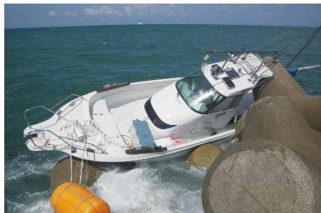
(※この写真は左記事例とは直接関係ありません)

花火大会観覧後の帰港中、漫然と前方を見ていたことにより、防波堤に衝突し、乗船していた7名全員が負傷しました。