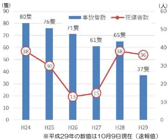
【遊漁船の事故隻数と死傷者数の推移】