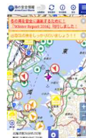
スマートフォン用サイト