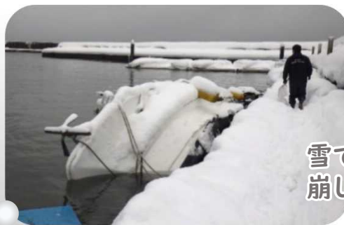
雪でバランスを崩し転覆…