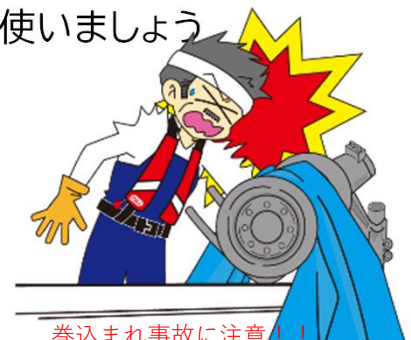
巻き込まれ事故に注意！！