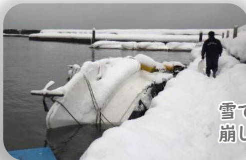
雪でバランスを崩し横転…