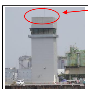
閃光式信号 (千葉航路)