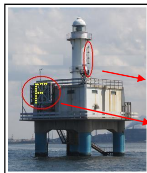
閃光式信号 (市原航路)